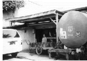
Urban Water Supply in Indonesia