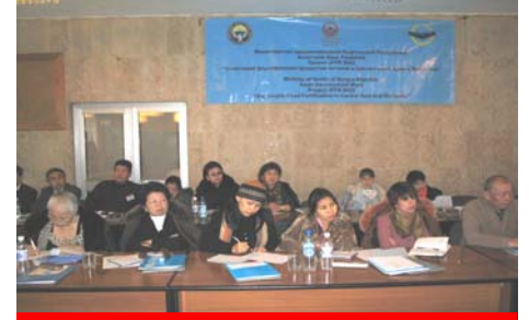
ММК жана ӨЭУ үчүн коммуникациялык стратегия боюнча өткөн Улуттук конференциянын катышуучулары

биргелешкен күч-аракеттердин зарылдыгын жана маанилүүлүгүн сезүүгө мүмкүндүк берди. Семинардын жыйынтыгында анын катышуучулары тарабынан Корутунду чечим кабыл алынды. Семинар өткөн күндөн тартып йод жана темир жетишсиздигинин ооруларын чагылдырып, ММК бетине алып чыгууда журналисттердин активдүүлүгү байкалууда.