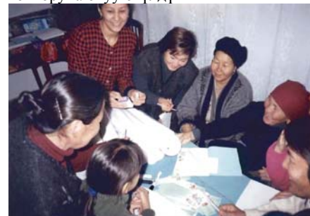
Үй кызматындагы аялдар тест-системанын жардамы менен туздагы йоддун камтылышын аныктап жатышат

од жетишсиздигинин ооруларын алдын-алуу жана йоддолгон тузду көбөйтүү боюнча өнөктүк аяктады, ал 2006-жылы 28-февралдан 30-апрелге чейин Ысыккөл областында болуп өттү. Республикалык ден соолукту чыңдоо борбору эл аралык уюмдар менен бирдикте республиканын региондорунда этап-этабы менен тест-өнөктүктөрдү өткөрүп жатат. Анын жүрүшүндө туздагы йодду текшерүү жана айылдарда туз комитеттерин түзүү негизги максат болууда. Ысыккөл областындагы тест-өнөктүктүн жыйынтыгында, Балыкчы жана Каракол шаарларында йоддолгон тузду көбөйтүү боюнча туз комитеттери түзүлдү. Комитеттин иши 2 багытты көздөйт, биринчиси – үй-бүлөлүк медицина кызматкерлеринин күчү менен үй чарбаларын текшерүү, экинчиси – курамына ДГСЭН адистери, мэрия, ТОС өкүлдөрү жана базар башчылары кирген туз комитетинин өкүлдөрү тарабынан ири соода түйүндөрүнүн текшерилиши. Бул өнөктүктүн алкагында 30 адамдан турган ден соолукту чыңдоо кызматынын адистери, айылдык ден соолук комитеттеринин жетекчилери, ошондой эле ГСВ/ФАП адистери менен СКЗ мүчөлөрү окутулду. Окуудан 511 адам өттү. Айылдык калк тест-системаларды колдонуунун ыкмаларына үйрөндү. Ден соолукту чыңдоо кызматынын областтык машыктыруучулары жана ден соолукту чыңдоо кабинеттеринин адистери тарабынан айылдык ден соолук комитеттеринин ишин турукташтырууга багытталган бир катар иш-чаралар аткарылды. Ушул эле өнөктүктүн алкагында, йод жетишсиздигинин оорулары жөнүндө маалымат берүү боюнча аракет топторуна окуу өтүлдү.