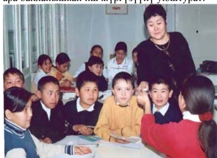
Карасуу шаарындагы орто мектептин окуучулары