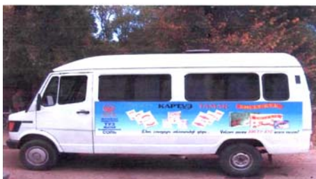
“Хедеф” ишканасынын продукциясы жана Логотиби рекламаланган

январындагы №42/1-буйругуна ылайык, мектептерге атайын иштелип чыккан методикалык окуу куралынын негизинде, йод жетишсиздигинин оорулары жана темир жетишсиздигинин анемиясын алдын-алуу чаралары, жөнүндө окуучулардын, мугалимдер менен ата-энелердин мектеп окуучуларынын сөзсүз түрдө байытылган тамак-аш азыктары: йоддолгон туз жана витаминдүү унду колдонуу зарылдыгы жөнүндө маалымат алуусун жогору көтөрүү жагы милдеттендирилген. Аталган министрлик тарабынан ошондой эле жалпы билим берүүчү мектептердин планына йод жана темир жетишсиздигин алдын-алуу маселелери боюнча сабактарды, класстык сааттар менен ата-энелер жыйындарын өткөрүү сунуш кылынды. Буйрук, мектепке чейинки мекемелерде, балдар үйлөрүндө, мектеп-интернаттарда, жалпы билим берүүчү мектептерде балдардын жана окуучулардын тамактануусун уюштурууда йоддолгон тузду, витамин-минералдуу унду гана пайдаланууну талап кылат. Республикалык ден соолукту чыңдоо борбору жергиликтүү билим берүү органдары менен бирдикте, туз жана ун чыгаруучу ишканалар менен мындай азыктарды сатып алган окуу мекемелеринин ортосунда өз ара байланышкан иш жүргүзүүнү уюштурат.