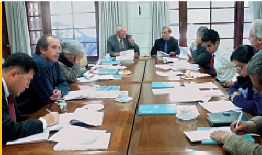
समीक्षा : एडीवी तथा जीटीजेडका कर्मचारीहरू संयुक्त कार्य योजनामा प्रस्तावित कार्यहरूको कार्यान्वयनमा हासिल भएका प्रगतिहरू समीक्षा गर्दै ।

सन् २००४ मा एडीवीले संयुक्त अधिराज्यको अन्तर्राष्ट्रिय विकास विभाग (डीएफआईडी) र जर्मन प्राविधिक सहयोग नियोग (जीटीजेड) सँग छुट्टाछुट्टै समन्वय कार्य योजनामा तयार गरेको थियो। सरकारको निश्चित विकास उद्देश्य तथा उपलब्धिहरूका लागि कार्यक्रम तर्जुमा तथा कार्यान्वयनमा रणनीतिक एकता र सामञ्जस्यता हासिल गर्ने उपायहरूको खोजी गर्न एडीवीले विश्व बैंकसँग मिलेर सहयोग एकरूपतासम्बन्धी दुईवटा कार्यक्रम पनि गरेको थियो। सन् २००४ डिसेम्बरमा एडीवी र विकास तथा समन्वयका लागि स्वीस नियोगबीच साफ्टा चासोका क्षेत्रहरूमा एकरूपता कायम गर्ने सम्भावनाहरूको खोजी गर्न छलफल भएको थियो। ■