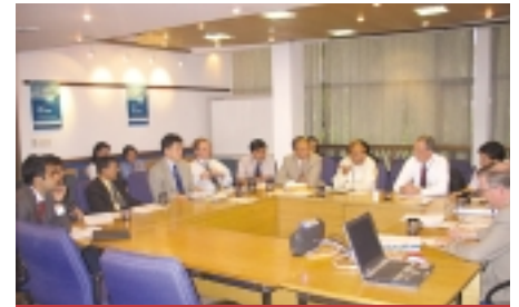
एकरूपता नेपाल आवासीय नियोग र डीफीडका कर्मचारीहरू आयोजना कार्यान्वयनमा आफ्ना अनुभवहरू आदानप्रदान गर्दै।

यसैगरी, नियोगले वि.सं. २०६१ साल भदौ १९ गते हस्ताक्षर भएको एडीबी/जीटीजेड संयुक्त कार्य योजना २००४-२००५ को प्रगति समीक्षा गर्न यही जेठ ९ गते जीटीजेड, काठमाडौं कार्यालयका कर्मचारीहरूसँग बैठक आयोजना गरेको थियो। यो जीटीजेडसँगको तेस्रो समीक्षा बैठक हो र यसलाई श्री रहमान तथा जीटीजेड, काठमाडौं कार्यालयका निर्देशक उत्क वेर्नेकले सभापतित्व गर्नुभएको थियो। ■