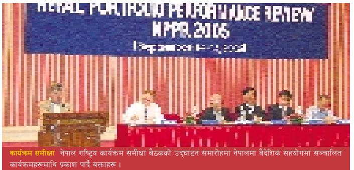
कार्यक्रम समीक्षा नेपाल राष्ट्रिय कार्यक्रम समीक्षा बैठकको उद्घाटन समारोहमा नेपालमा वैदेशिक सहयोगमा सञ्चालित कार्यक्रमहरूमाथि प्रकाश पार्दै वक्ताहरू।

सरकार, एडीबी, अन्तर्राष्ट्रिय सहयोगका लागि जापान बैंक र विश्व बैंकद्वारा यही भदौ २९ देखि ३१ गतेसम्म संयुक्तरूपमा आयोजित नेपाल राष्ट्रिय कार्यक्रम समीक्षा बैठक (सीपीआरएम) मा एडीबीले भाग लियो। बैठकमा छलफल भएका प्रमुख अवधारणाहरूमा एकीकृत सहायता संरचना तथा एकरूपतासम्बन्धी विधिको सुधार, विकास परिणामहरूका लागि व्यवस्थापन र आयोजना विशेषमा