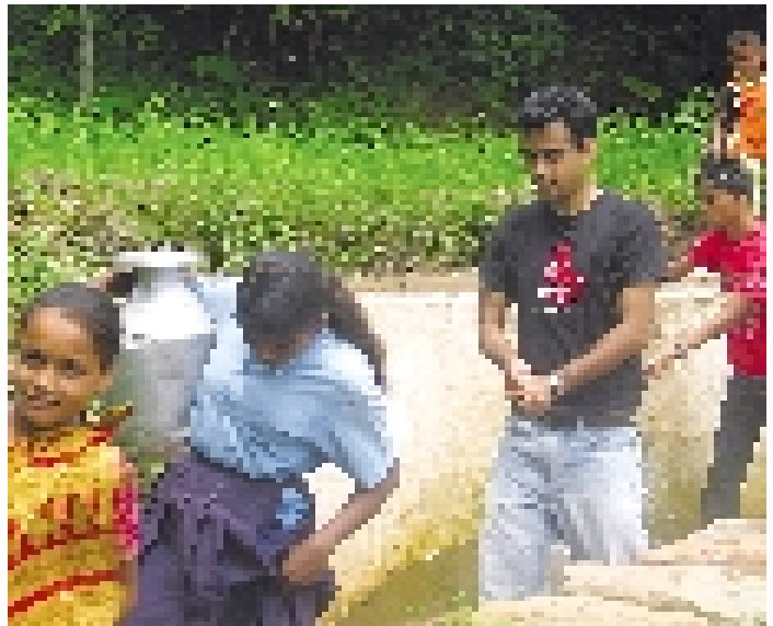
सबैका लागि खानेपानी वाग्लुङमा एडीवीको सहयोगबाट दलित समुदायका लागि निर्माण गरिएको धारामा पानी भदौ महिलाहरू ।

यसैगरी, दाङ जिल्लाको गरिवी निवारणका लागि स्थानीय पहलसम्बन्धी आयोजनाले साक्षरतापछिको शिक्षा, आयमूलक तालिम, लघुवित्त र बजारसम्म पहुँचका माध्यमबाट महिला सशक्तिकरण गरी गरिवी घटाउने उद्देश्य लिएको छ । ■