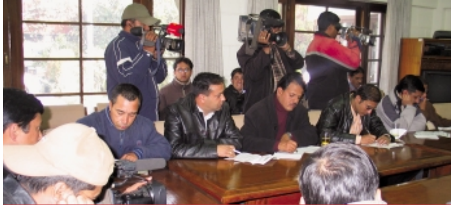
प्रेस अन्तर्क्रिया नेपाल आवासीय नियोगले वर्षको अन्तमा आयोजना गर्ने प्रेस अन्तर्क्रिया कार्यक्रममा विभिन्न स्थानीय तथा विदेशी समाचार संस्थाहरूबाट सहभागी पत्रकारहरू ।

'सहायताको प्रभावकारिता हासिल गर्न सन् २००४ अक्टोबरमा पारित भएको परिणाममुखी राष्ट्रिय रणनीति तथा कार्यक्रमको कार्यान्वयनमा एडीबीले जोड दिइरहेको छ', उहाँले भन्नुभयो । सहायता कार्यक्रमको कार्य-सम्पादन कमजोर हुनुमा राजनीतिक अस्थायित्व, पटकपटक हुने सरकार परिवर्तन र यसको परिणामस्वरूप बरिष्ठ सरकारी अधिकारी तथा आयोजनाका कर्मचारीहरूमा हुने सरुवा तथा सरकारको निर्णय प्रक्रिया