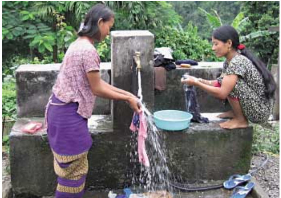
सबैका लागि खानेपानी ग्रामीण क्षेत्रका महिलाहरूले सार्वजनिक धारो प्रयोग गर्न घन्टौं हिंड्नुपर्छ। आफ्नै घर नजिक सार्वजनिक वा सामुदायिक धारोको सुविधा पाउने भाग्यमानी कमै हुन्छन्।

‘सर्वसम्मतिको माध्यमबाट परियोजना संरचना (डिजाइन)’ नामक दोस्रो चरणमा क्षेत्रगत सर्वसम्मति विकास गर्ने प्रयास गरियो। व्यवसायिक सहजकर्ताहरूको टोलीले यसको प्रबन्ध मिलाएको थियो। यस क्रममा केही मुद्दाहरूमा सर्वसम्मति कायम गर्न १६ वटा सर्वसम्मति-विकास कार्यशालाहरू तथा थुप्रै अनौपचारिक छलफलहरू आयोजना गरिएका थिए। नेपालको खानेपानी, सरसफाई र सामुदायिक स्वास्थ्य विकास कार्यक्रमसँग सम्बन्धित सरकारी निकाय, बहुपक्षीय तथा द्विपक्षीय विकास संस्था, अन्तर्राष्ट्रिय तथा राष्ट्रिय गैर सरकारी संस्थाहरू, निजी क्षेत्रका फर्म र व्यक्तिहरूको त्यसमा सहभागिता रहेको थियो।