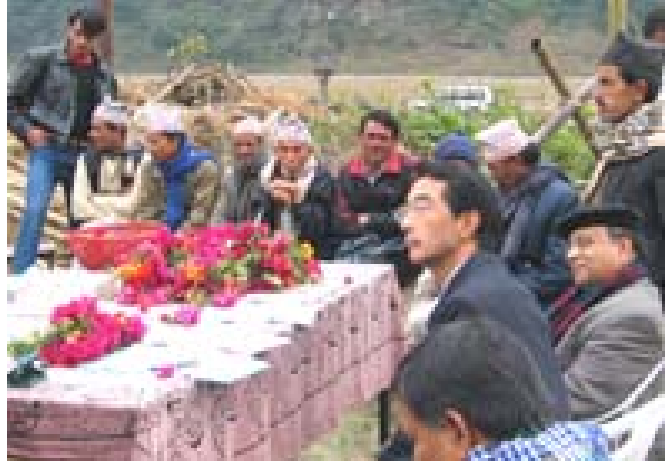
जनताको आवाज एडीबीको सहायतामा सञ्चालित तेश्रो पशु विकास आयोजनासम्बन्धमा स्थानीय किसानहरूको कुरा सुन्दै एडीबीको दक्षिण एसिया विभागका महानिर्देशक योशिहिरो इवासाकी।

अन्तर्राष्ट्रिय समन्वयका लागि जापान बैंकको सहयोगमा सञ्चालित कालीगण्डकी ‘ए’ जलविद्युत् आयोजनाको उद्घाटन समारोहमा पनि भाग लिनुभएको थियो। सरकारी अधिकारीहरूसँगको कुराकानीमा उहाँले यस आयोजनाअन्तर्गत कार्यान्वयन हुन बाँकी रहेका मुद्दाहरूलाई सम्बोधन गर्नुपर्ने आवश्यकतामाथि जोड दिनुभएको थियो।