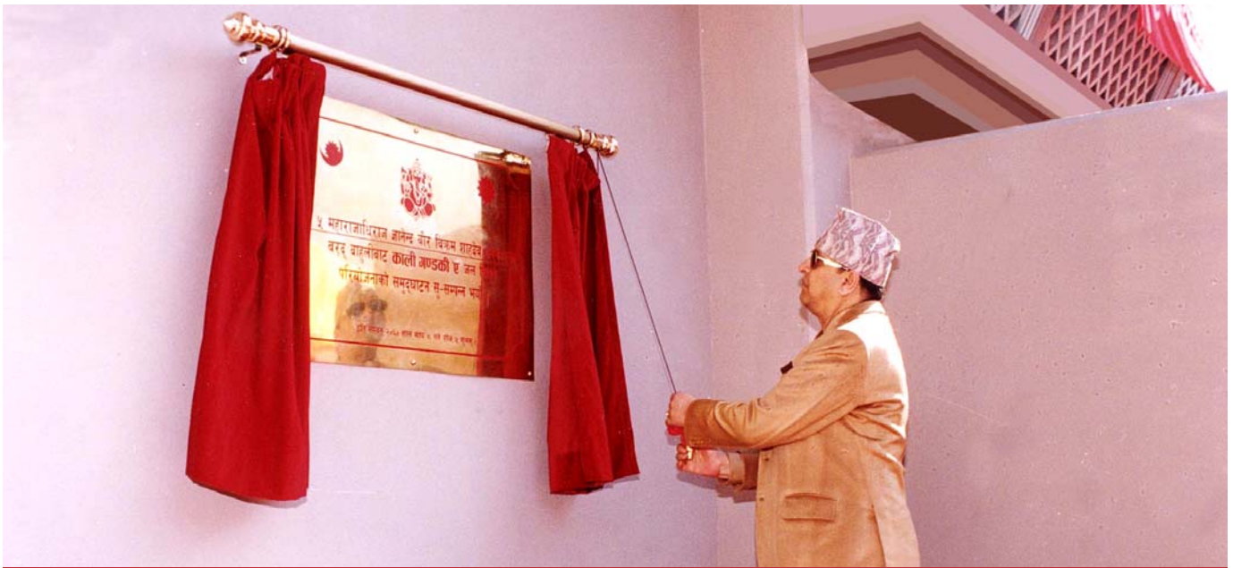
उद्घाटन श्री ५ महाराजाधिराज ज्ञानेन्द्र वीर विक्रम शाहदेव सरकारबाट नेपालको सबभन्दा ठूलो जलविद्युत् आयोजना कालीगण्डकी 'ए' समुद्घाटन गरिबक्सदै ।

श्री ५ महाराजाधिराज ज्ञानेन्द्र वीर विक्रम शाहदेव सरकारबाट २०१९ साल माघ ८ गते कालीगण्डकी 'ए' जलविद्युत् आयोजनाको समुद्घाटन गरिबक्स्यो । नेपालमा वारम्बार विद्युत् आपूर्ति अवरुद्ध हुने समस्या समाधान गर्न एसियाली विकास बैंक (एडीबी) को सहयोगमा यो आयोजना सञ्चालन गरिएको हो ।