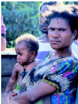
Mama isave karim hevi bilong lukaitim femali