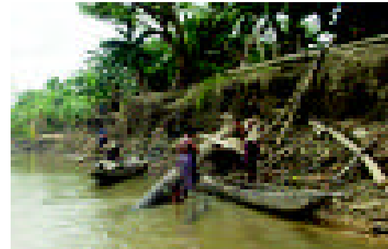
Sindaun nogut iwok long kamap bikpela moa long asples na taun wantaim

Planti moa pipal long PNG ipaul namel long planti hevi ibungim ol. Iolsem wanpela man isanap namel long rot ikatim narapela rot (kros rot). Sampela pipal i stap bek long asples na i strongim pasin bilong wok gaden, oli go long solwara na wara bilong painim pis na painim welabus long bik bus na mekim narapela kain samting olsem, behainim wei bilong tumuna. Tasol ol nupela senis ikamapim bikpela laik o nit bilong moni olsem na planti pipal ibungim hevi long en. Planti sevis bilong nesenal gavman ino go insait long ples bilong givim helpim long ol pipal. Dispela