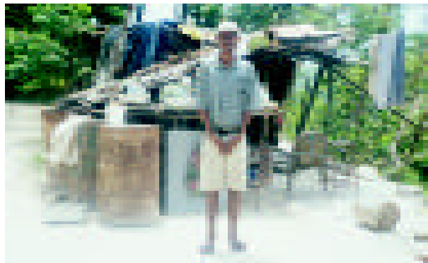
Haus oli mekim long pipia

Bikpela moa hevi we ol man iluk save long en, em gutpela wara bilong dring na tu we ino gat gutpela rot bilong pipal inap wokabaut long en. Wanpela man bilong Talvat Sikut husat iwok long bekim ol askim emi tok "...givim mipela tasol long rot...na lukluk wanem mipela inap long wokim."