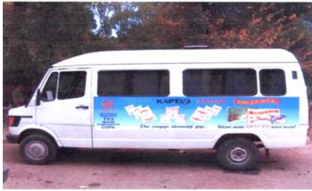
Микроавтобус с рекламой Логотипа и продуктов предприятия «Хедеф»

этого они использовали в наружной рекламе Логотип «Татымдуу тамак аш» на муниципальном транспорте города Бишкека, пригородных районов Арча-Бешик, Ак-Орго, Ак Босогу, Ынтымак, Чон Арык, Ала Тоо, Бакай Ата, а также Сокулукского и Иссык-Атинского районов. Во всех перечисленных пригородных селах, и районах Чуйской области, где ездят такие маршрутные автобусы, в основном, проживает приезжее население, большая часть которых малообеспеченные, многодетные семьи. Руководство маркетингового отдела предприятия отмечает, что местное население стали больше обращать внимание на знак и спрашивать о значении при покупке продуктов.