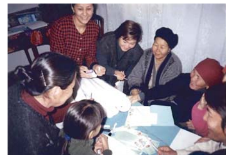
Домохозяйки определяют соль на содержание йода с помощью тест-системы

Завершилась кампания по профилактике йоддефицитных состояний и продвижению йодированной соли, которая проходила с 28 февраля по 30 апреля 2006 года в Иссык-Кульской области. Республиканский центр укрепления здоровья совместно с международными организациями поэтапно проводят тест-кампанию в регионах республики. Основным инструментом в проведении тест-кампании является использование тест-систем для определения йода в соли и создание Солевых комитетов в селах. По итогам проведенной тест-кампании в Иссык-Кульской области, в городах Балыкчи и Каракол созданы Солевые комитеты, по продвижению йодированной соли. Работа комитета имеет 2 направления, первое - обследование домохозяйств силами медицинских работников ГСВ и второе - обследование крупных торговых точек представителями Солевого Комитета, куда входят специалисты ДГСЭН, мэрии, ТОС и базаркомы. В рамках данной кампании были обучены специалисты службы укрепления здоровья и руководства сельских комитетов здоровья (СКЗ) в количестве 30 человек, а также специалисты ГСВ/ФАПов и членов СКЗ. Обучено 511 человек. Сельское население обучены навыкам использования тест-систем. Областными тренерами службы Укрепления Здоровья и специалистами кабинетов укрепления здоровья (КУЗ) проведен ряд мероприятий, направленных на устойчивость работы Сельских комитетов здоровья. В рамках данной кампании обучены Группы действия по предоставлению информации о йоддефицитных состояниях.