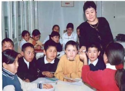
Учащиеся средней школы с.Кара-Суу

По словам специалиста Министерства образования Валентины Горкиной, в этом году Правительством КР выделены 99,7 млн. сом для организации питания в 562 школах для питания 86463 школьников начальных классов высокогорных и отдаленных школ. В соответствии с приказом Министерства образования и науки КР №42/1 от 25 января 2006г., школам предписано повышать информированность учащихся, учителей и родителей о мерах профилактики йоддефицитных заболеваний и железодефицитной анемии, о необходимости употребления обогащенных продуктов питания йодированной соли и обогащенной витаминами муки, и об обязательном использовании в питании школьников обогащенных продуктов питания на основе специально разработанного методического пособия. Министерством образования также рекомендовано вносить в план общеобразовательных школ проведение уроков, классных часов и родительских собраний по вопросам профилактики ЙДЗ и ЖДА. Приказ требует при организации питания детей и учащихся в дошкольных учреждениях, детских домах, школах-интернатах, общеобразовательных школах использовать только йодированную соль и муку, обогащенную витаминно-минеральными добавками. Республиканский центр укрепления здоровья совместно с местными органами образования организует взаимодействие между соляными и мукомольными предприятиями и учебными учреждениями по закупке таких продуктов питания.