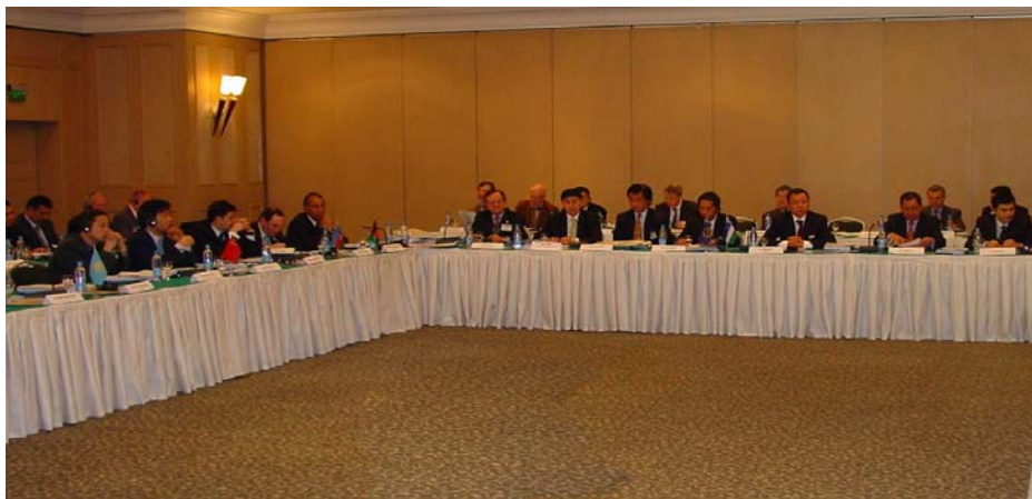
СЕМИНАР ЦАРЭС Официальные лица из таможенных служб, торговли и транспорта стран-участниц ЦАРЭС обсуждают заключительный проект Отчета о реализации Стратегии развития транспорта и торговли.

Около 80 инвестиционных проектов и 45 проектов технического содействия определены стратегией для реализации с целью развития шести транспортных коридоров в течение последующих 10 лет. Ожидается, что около половины средств на эти цели будут предоставлены многосторонними организациями, такими как АБР, а остальная часть будет выделены самими странами. ■