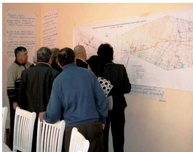
The villagers' interest in the road design is huge Жители села с большим интересом знакомятся с проектом дороги Ауыл тұрғындары зор ықыласпен жолдың жобасымен танысып жатыр