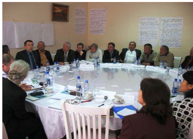
Participants listening to Committee of Road's explanations Участники слушают разъяснения представителя Комитета автомобильных дорог Қатысушылар Автомобиль жолдары комитетінің өкілін тыңдап отыр