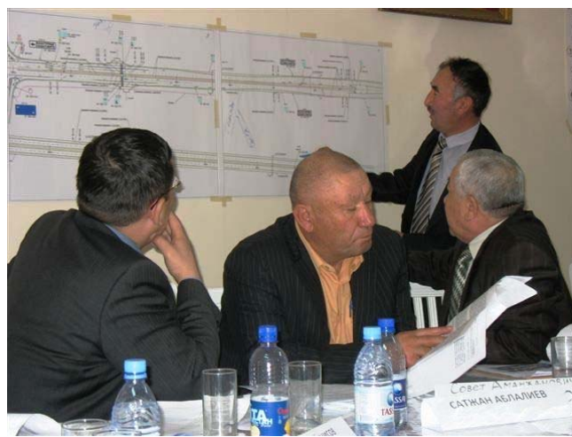
The maps help communicating more clearly Карта помогает лучше понимать ситуацию Карта жағдайды жақсырақ түсінуге көмектеседі