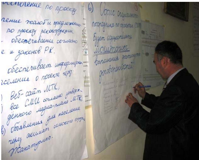
Signing the agreement Подписание соглашения Келісімге қол қою