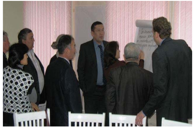
A small group formulates the agreement Небольшая группа формулирует соглашение Шағын топ келісімді тұжырымдауда