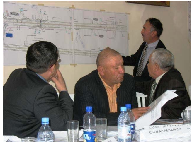
The maps help communicating more clearly Карта помогает лучше понимать ситуацию Карта жағдайды жақсырақ түсінуге көмектеседі