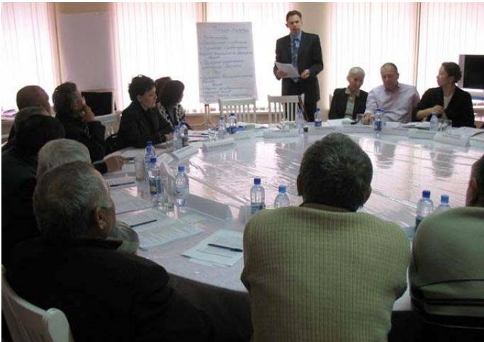
Facilitator opens the consultation in Merke Фасилитатор открывает консультацию в Мерке Фасилитатор Меркедегі кеңес жүргізуді ашып жатыр