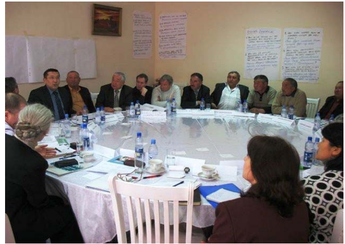
Participants listening to Committee of Road's explanations Участники слушают разъяснения представителя Комитета автомобильных дорог Қатысушылар Автомобиль жолдары комитетінің өкілін тыңдап отыр