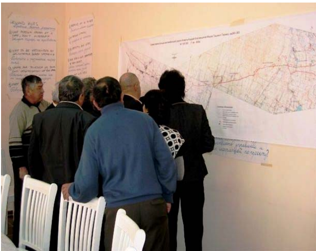
The villagers' interest in the road design is huge Жители села с большим интересом знакомятся с проектом дороги Ауыл тұрғындары зор ықыласпен жолдың жобасымен танысып жатыр