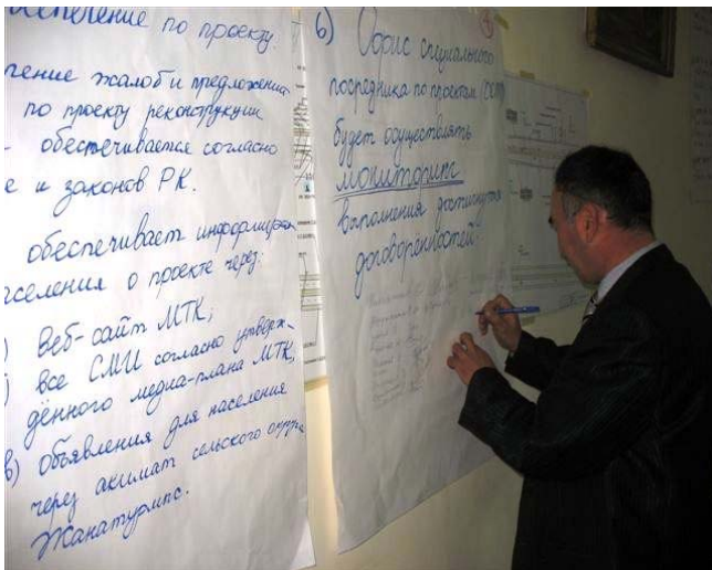
Signing the agreement Подписание соглашения Келісімге қол қою