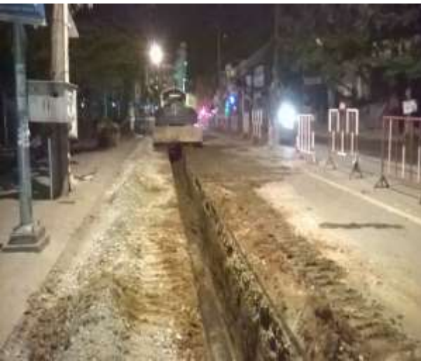
Job description / Mô tả công việc: installation of pipe / lắp đặt ống. Time construction: at night/ Thời gian thi công: ban đêm