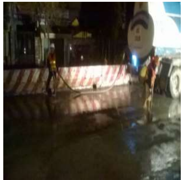
Job description / Mô tả công việc: Cleaning road surface DN500 / Vệ sinh mặt đường Time construction: at night/ Thời gian thi công: ban đêm