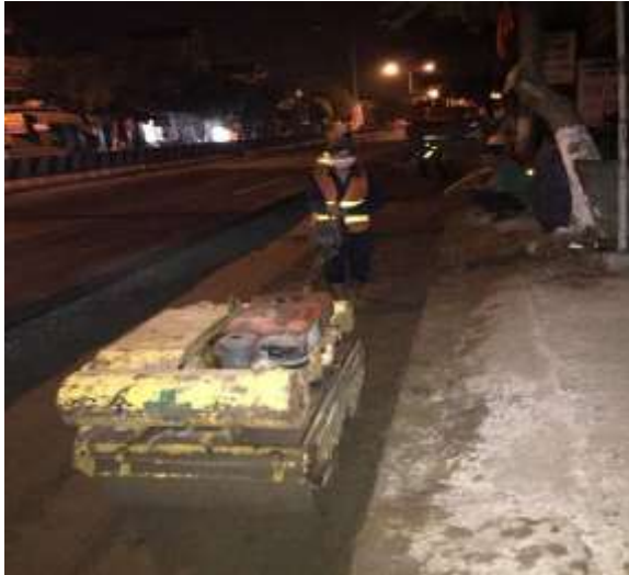
Job description / Mô tả công việc: Sand filling for pipes-manhole / Đắp cát ống Time construction: at night/ Thời gian thi công: ban đêm