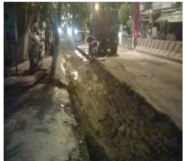
Job description / Mô tả công việc: Sand filling for pipes-manholes /Đắp cát ống Time construction: at night/ Thời gian thi công: ban đêm