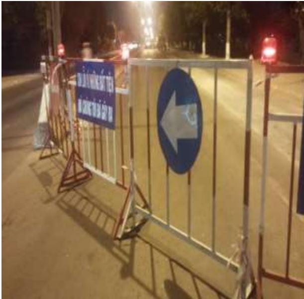
Job description / Mô tả công việc: Installation barrier system ,warning signs/ Lắp đặt hàng rào , biển báo Time construction: at night/ Thời gian thi công: ban đêm