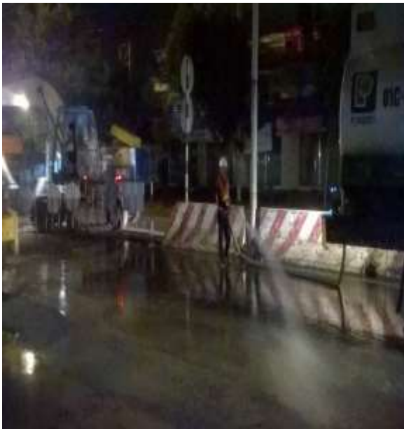
Job description / Mô tả công việc: Cleaning road surface DN500 / Vệ sinh mặt đường Time construction: at night/ Thời gian thi công: ban đêm