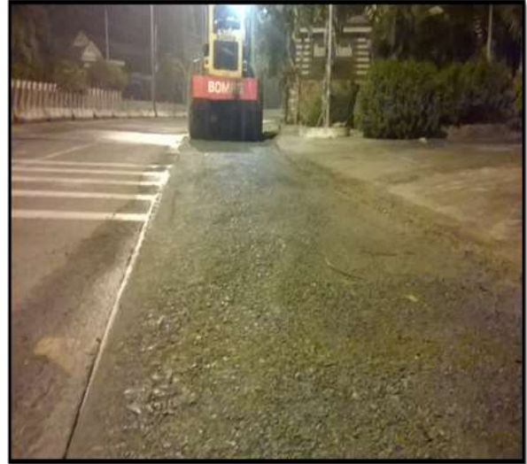
Job description / Mô tả công việc: Ballas aggregate 0x4 / Làm mặt đường đá 0x4 Time construction: at night/ Thời gian thi công: ban đêm