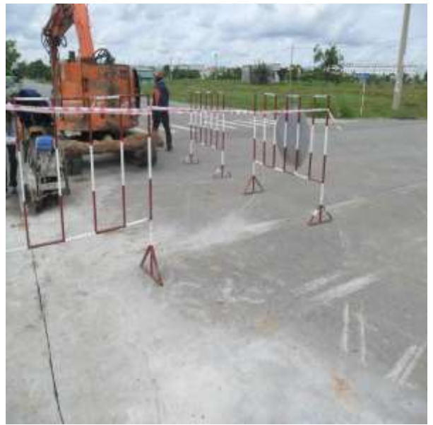
Job description: Installation barrier system ,warning signs/ Lắp đặt hàng rào , biển báo Time construction:a day/ Thời gian thi công: ban ngày