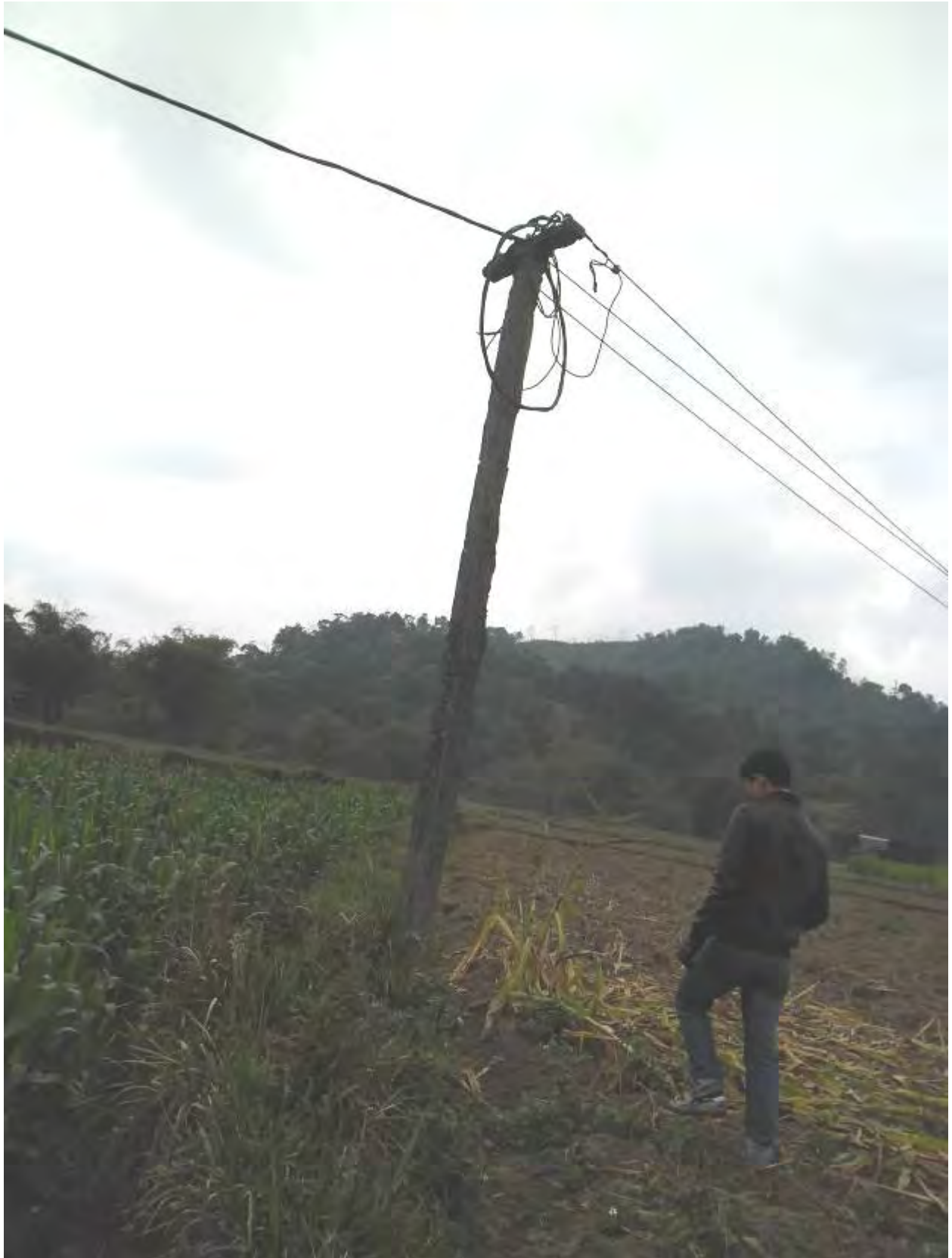
Power lines– Trung Thanh commune- Bac Quang District