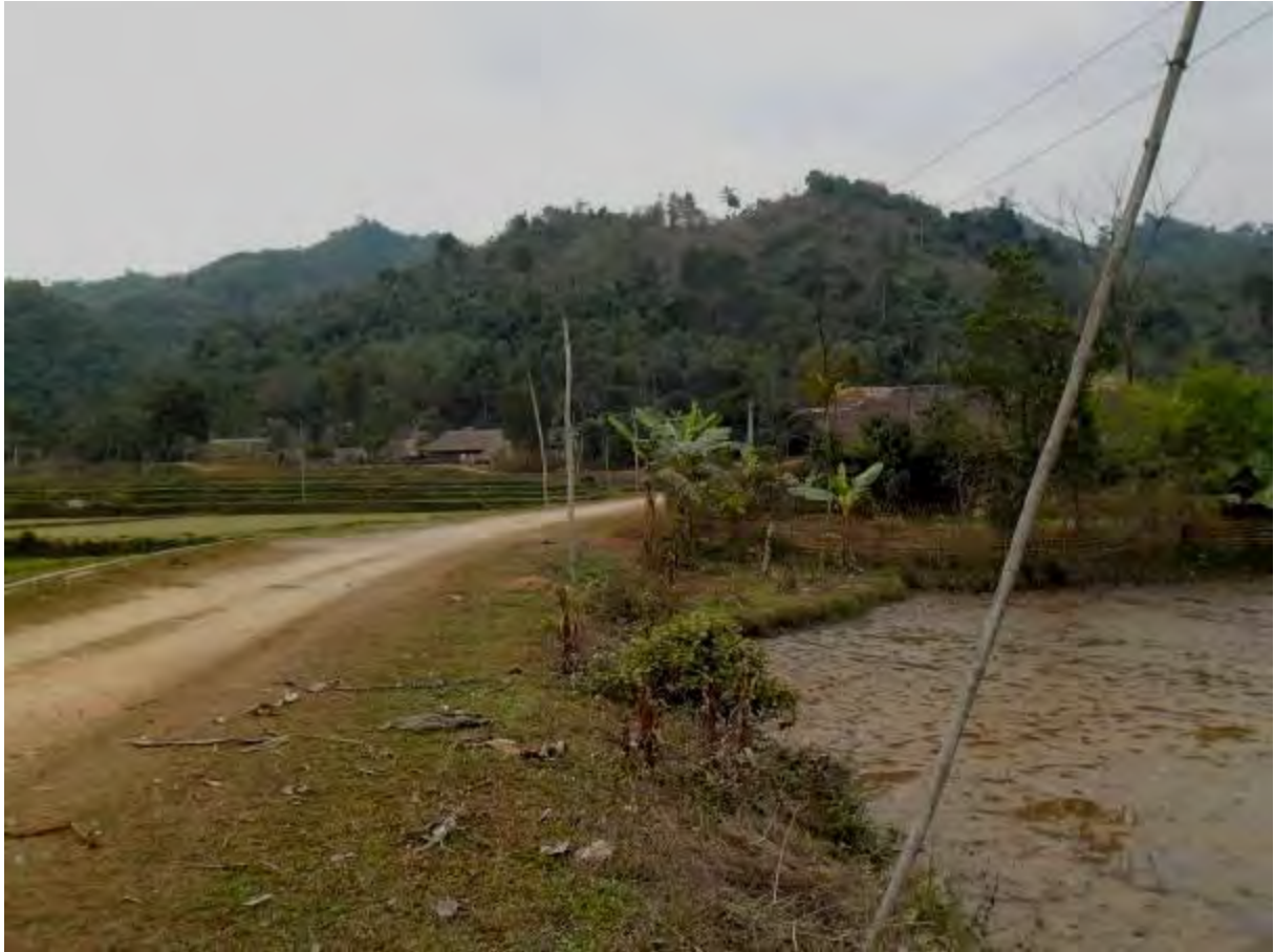
Power lines– Lien Hiep commune – Bac Quang District