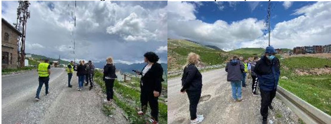
Figure 3: Photos of Site Visit (June 4, 2021)