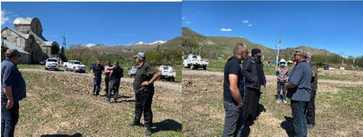
Figure 2: Photos of the public consultation meeting (May 20, 2021)