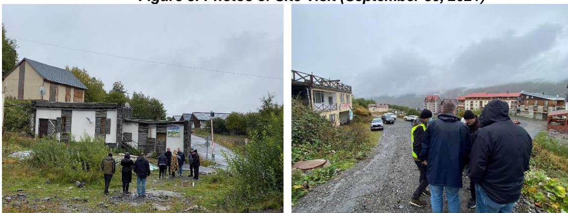
Figure 3: Photos of Site Visit (September 30, 2021)